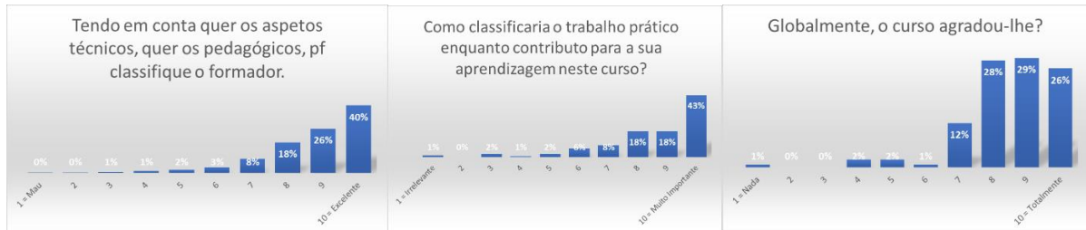
Figura 2: a - Formadores; b - trabalhos práticos; c - avaliação global

espaço, toda a informação, tendo-se optado por apresentar uma pequena amostra de alguns dos pontos avaliados (Ver Figura 2):